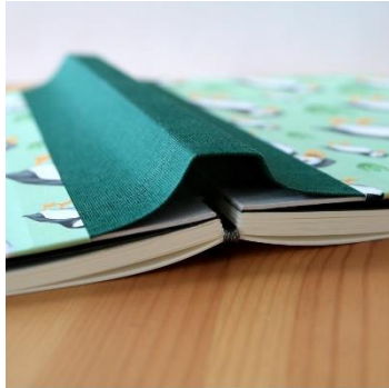
Sewn-board binding *